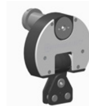
2 Messelement ASK-2