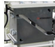
2 Messelement PSW-1