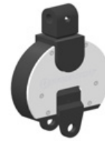
2 Messelement KRW-2