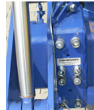
2 Messelement FLW-1