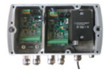
3 Neigungssensor in Klemmkasten